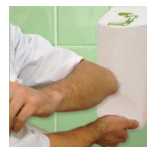
Manos. Riesgo higiénico