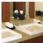
Servicios y lavabos