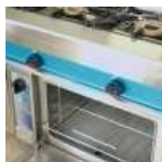
Hornos y planchas