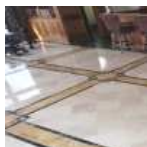
Suelo mármol y terrazo