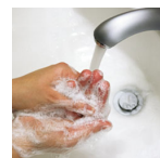
Manos. Lavado público general